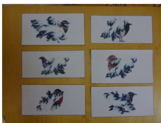
Д/и «Кто спрятался»