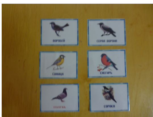
Картинки «Зимующие птицы»