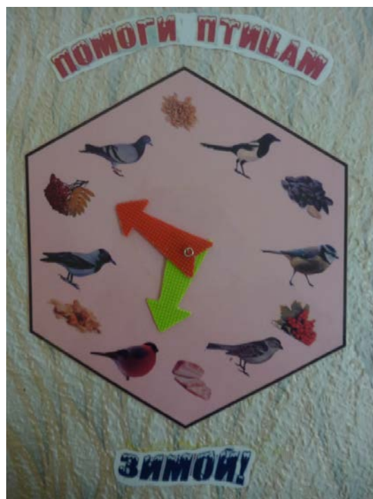
Картина «Помоги птицам зимой»