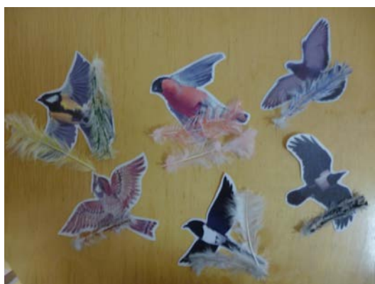
Д/и «Кто потерял перо»