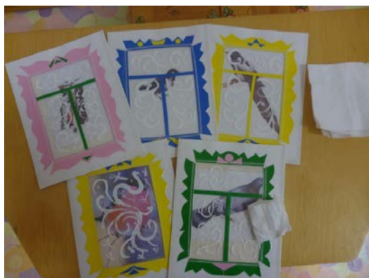
Окна с узорами